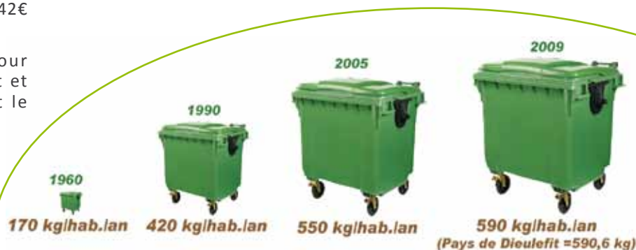
Évolution de la quantité de produits par habitants et par an (moyenne nationale source ADEME)